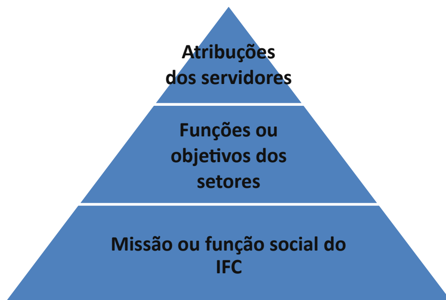
Figura 2: Funções da instituição, dos setores e dos servidores em forma de pirâmide de maneira a ilustrar a missão ou função social do IFC como o fundamento da instituição.

A missão do Instituto Federal Catarinense, encontrada no Plano de Desenvolvimento Institucional 2014-2017 – Proporcionar educação profissional atuando em ensino, pesquisa e extensão comprometida com a formação cidadã, a inclusão social e o desenvolvimento regional – constitui um ponto de partida para a avaliação da responsabilidade que a instituição tem para com a sociedade. Ela é um esforço coletivo para sintetizar em uma expressão o que a sociedade espera como resultado dessa organização de educação.